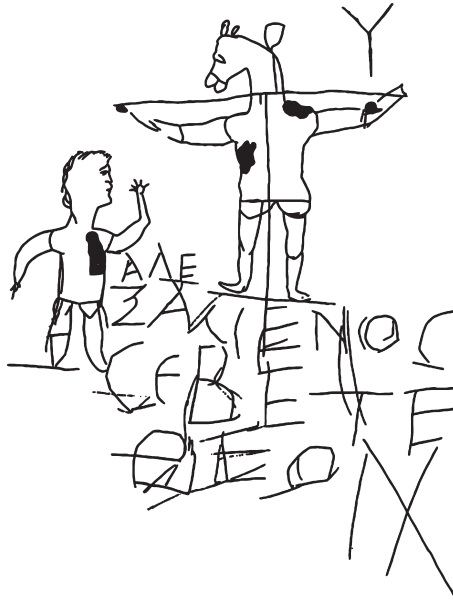
Abb. 2. Spottkruzifix vom Palatin. Nachzeichnung

verspotten. Es gibt eine doppelte blasphemische Spitze dabei: die Anbetung eines Gekreuzigten und die Anbetung eines Eselsköpfigen. Im deutschen Sprachgebrauch ist oft die Rede vom ‚Spottkruzifix‘, in anderen Sprachen ist es als ‚blasphemische Kreuzifix‘ bekannt. Um Missverständnissen und Enttäuschungen vorzubeugen: Ich möchte mich im vorliegenden Beitrag keineswegs gegen die geläufige Interpretation wenden. Vielmehr möchte ich versuchen, dem beschriebenen Graffito durch sorgfältige Kontextualisierung neue – im Sinne von: mehr – Aussagen abzugewinnen. Das Graffito wird, wie schon gesagt, sehr häufig abgebildet und angesprochen, aber fast immer im Umfang von wenigen Zeilen und kaum je mit irgendwelcher Kontextinformation – außer vielleicht einem Datierungshinweis. Die communis opinio setzt die Kritzelei meist ins 3. Jahrhundert, oft eher zu dessen Beginn als an dessen Ende.