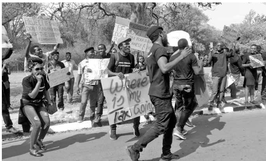
Demonstration während der Rede der Finanzministerin zum Budget, 28. September 2018, Lusaka (Bild zVg).

Vor einem Jahrzehnt war das Land noch praktisch schuldenfrei. Als die PF 2011 an die Macht kam, betrug die Auslandsschuld noch 1,9 Milliarden USD. Innerhalb von sieben Jahren stieg sie auf 9,4 Milliarden, wobei einige Experten fürchten, dass die Schuldenlast in Wirklichkeit noch höher ist, weil nicht alle Verpflichtungen gegenüber dem Ausland öffentlich bekannt sind. Fi-