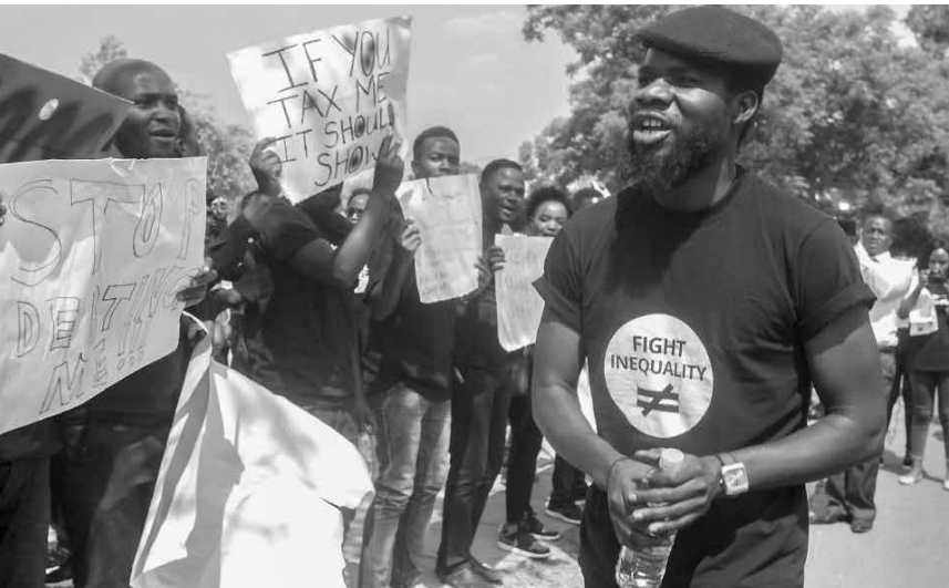
Demonstration während der Rede der Finanzministerin zum Budget, 28. September 2018, Lusaka.