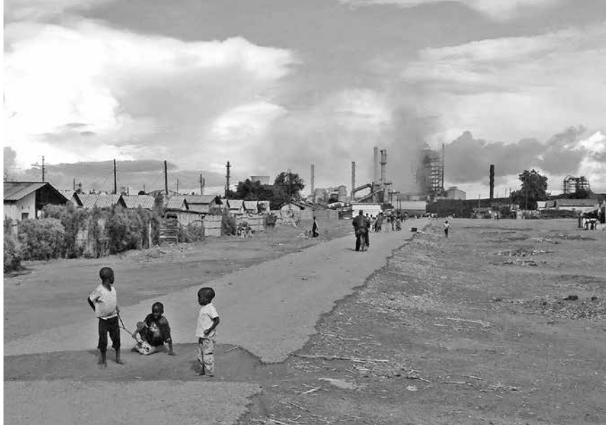
Die Nachbarschaft der Mopani Mine in Mufulira. Die Bedeutung des Bergbausektors als Arbeitgeber hat sich in Zambia grundlegend geändert.