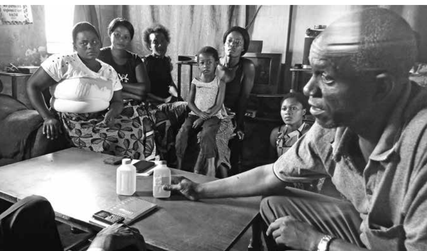
«Trinkwasser»-Probe in Kankoyo, Mufulira anlässlich eines KEESA-Besuches.

Solifonds-Kampagne: Mufulira will endlich sauberes Wasser ag. «Wer kann, der zieht weg von hier», sagten unsere Partner aus dem Städtchen Mufulira im sambischen Kupfergürtel. Die Kupfermine Mopani gehört seit der Verstaatlichung der sambischen Minen Anfang der 2000er-Jahre mehrheitlich Glencore. Viele haben sich damals wohl eine Verbesserung ihrer Lebensbedingungen erhofft, doch das trat nicht ein. Die Häuserfassaden blättern aufgrund des sauren Regens ab, die Luft führt zu Atemproblemen, viele Jobs in der Mine sind verschwunden. Und dann noch das «Trinkwasser»: das Wasser hat sichtbare Rückstände, und niemand trinkt es, ohne es zuvor abgekocht zu haben. Deshalb wollen die Bewohnerinnen der Quartiere Butondo, Kankoyo und Kantanshi rund um die Mine Mopani, wenn sie schon nicht wegziehen können, zumindest sauberes Wasser.