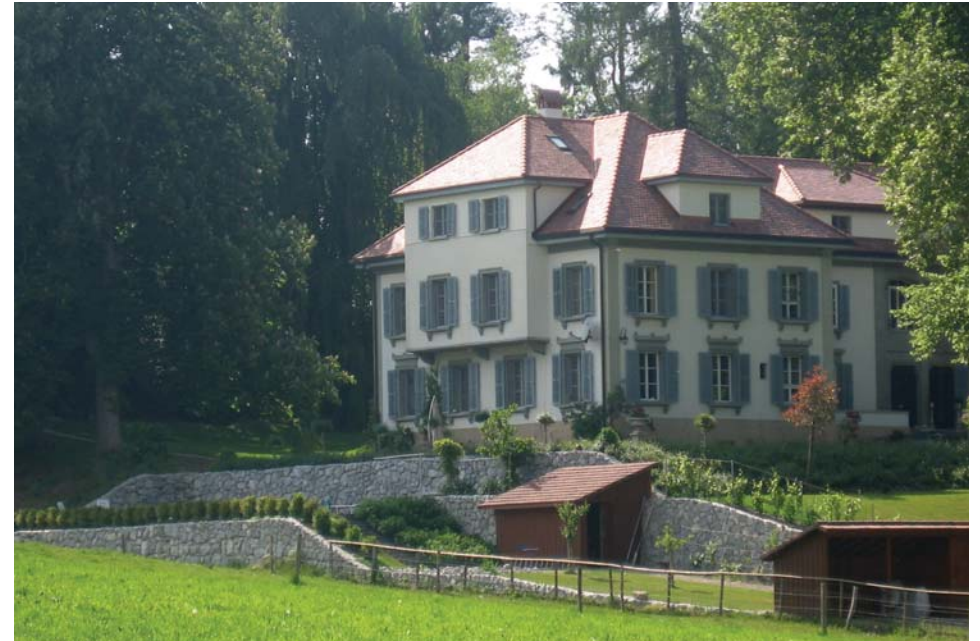
Das ehemalige Institut Froideville bei Posieux, FR. Einst ein bedeutsamer Ort für die Ethnologie und Afrikaforschung in der Schweiz, beherbergt das Gebäude heute ein Bed and Breakfast (Bild: BnB Maison des anges, Froideville).