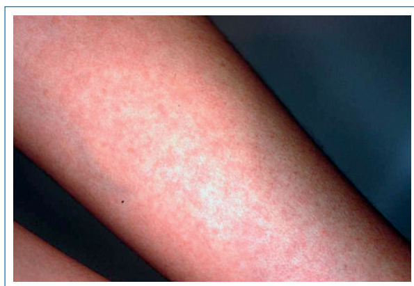
Abbildung 2 Morbilliformer Hautausschlag bei Dengue-Fieber.

sehen Touristen erschreckt auf den ersten Blick. Sie könnte aber durch Kreuzreaktionen mit anderen Flaviviren und durch Impfungen gegen Gelbfieber, Japanische Enzephalitis oder Frühsummer-Meningoenzephalitis verursacht sein oder auf frühere, zum Teil asymptomatisch oder oligosymptomatisch verlaufende Infektionen zurückzuführen sein.